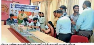
मोफत आरोग्य तपासणी शिबिरात नागरिकांची तपासणी करताना डॉक्टर.