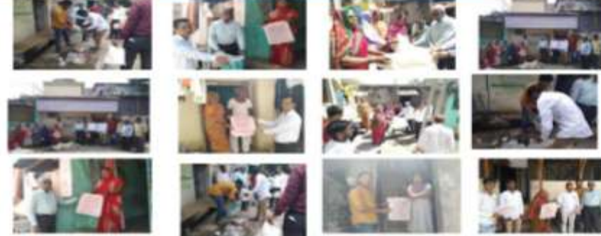
Campaign on awareness of awareness effects of Plastic pollution on environment.