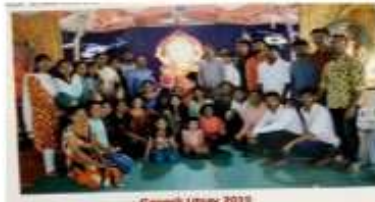
Ganesh Utsav 2019